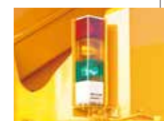
▲ACS外部表示装置(オプション)