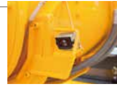
▲前方直前確認カメラ