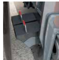
▲車輪止め(オプション)