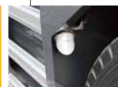
▲路肩灯(オプション)