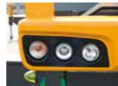
▲丸型プロジェクタータイプヘッドランプ (ディスチャージはオプション)