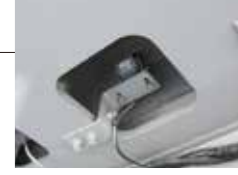
▲ウインチ確認カメラ(オプション)