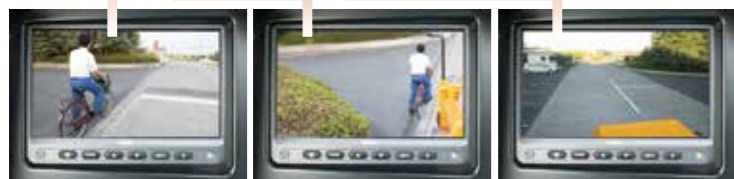
▲前方直前画面 ▲左前方画面 ▲後方画面