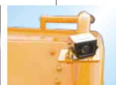
▲左前方確認カメラ